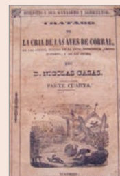
La cría de las aves de corral