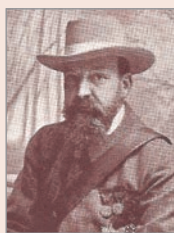
Salvador Castelló Carreras

En 1896 se inaugura la Escuela de Avicultura de Arenys de Mar (Barcelona) y comienza la publicación de la primera revista avícola española, La Avicultura Práctica . Salvador Castelló Carreras fue su impulsor y, tras formarse en el Instituto Agronómico de Gembloux (Bélgica) y visitar Holanda, Francia e Inglaterra, fundó en 1894 la Granja Paraíso. Luego vendrían, la Escuela, la revista, las publicaciones, etc. (Mendizabal, 2007). La Escuela de Avicultura de Arenys de Mar, fue clave para que España sea uno de los países europeos más desarrollados en producción avícola. Al respecto, hay que destacar la gran labor que los veterinarios realizaron para que España ocupe ese lugar. Pretendemos mostrar la aportación de eminentes veterinarios en el desarrollo de la avicultura española, desde mediados del siglo XIX hasta 1936.