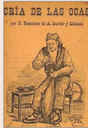
Cría de las ocas