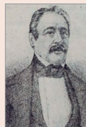
Nicolás Casas de Mendoza

Su obra fundamental fue el Tratado de la cría de las aves de corral, de las abejas, gusanos de seda, cochinilla, grana, quermos y de los peces , (1844) que completaría años más tarde, con Manual de la cría lucrativa de las gallinas y demás aves de corral (1872), verdadero compendio de ciencia avícola.