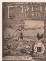
Portada de La Avicultura Práctica