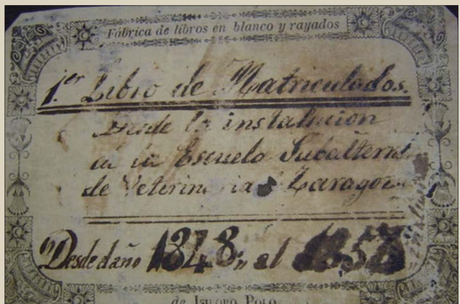
1º libro de matriculación.

Los alumnos cursaron según el Art 4 del citado Real Decreto: Operaciones, venda-