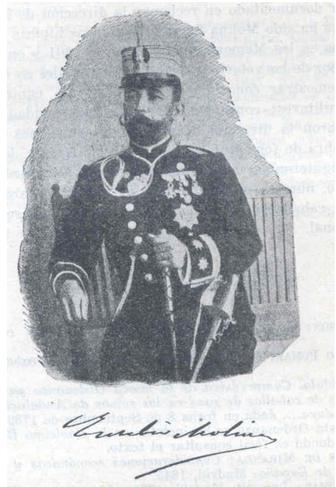
Foto nº 9 Eusebio Molina Serano Coronel Veterinario y reformador de la Veterinaria Civil

En el mismo sentido, se pronuncia la Instrucción para el gobierno económico y político de las provincias de 3 de febrero de 1823. Y todavía, en 1834, los arts. 9 y 10 del Real Decreto de 20 de enero de 1834, encargan a la autoridad municipal que se señale uno o más parajes acomodados para mercado o plaza pública y para mataderos; procurando que haya buen orden, aseo y limpieza en ellos, comodidad para los ciudadanos y vigilancia para que no se infrinjan las reglas de salubridad y las relativas a la exactitud de los pesos y medidas 66 , se sigue vinculando la vigilancia de los alimentos a los Ayuntamientos por intermedio de sus veedores " carniceros revisores en mataderos y mercados " 67 .