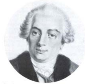
Foto nº 4 Claude Bourgelat

Si el máximo mandatario alemán fracasó por diversas razones, entre ellas la incompreensión de sus súbditos, el pensamiento francés del siglo XVIII parece un terreno abonado para iniciativas semejantes; en la filosofía de la naturaleza imperante en la época, encaja perfectamente la redención y hasta el bienestar de los animales y sus pontífices ven en el estudio de la anatomía, la fisiología y la patología comparadas, una oportunidad única para la práctica de sus ilustradas ideas y entre sus adeptos, Claude Bourgelat, encontrará los apoyos necesarios para lograr su objetivo: una Escuela de Veterinaria.