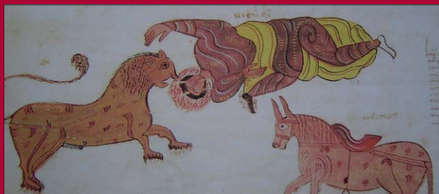
FIG. 15.- Fol. 142 v. El profeta de Judá muere atacado por un león. El caballo de largas orejas permanece expectante.

LA IMAGEN SIMBÓLICA DE LOS CABALLOS SEGÚN SU COLOR VARÍA EN EL CASO DEL CABALLO BLANCO, YA QUE PARA ALGUNOS SIGNIFICA LA MUERTE; PARA OTROS, EN CAMBIO, REPRESENTA A CRISTO VENCEDOR, SÍMBOLO DE PAZ, YA QUE PORTA UNA CORONA Y VENDE A LA MUERTE.