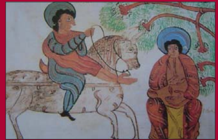
FIG. 14.- Fol. 142 r. Caballo con largas orejas. El profeta llegado de Judá recibe la visita del viejo que vivía en Betel.

Iue 5:22 "Entonces resonaron los cascos de los caballos. En la veloz huida de los guerreros, 'maldecid a Meroz', dijo el ángel de Yavé."