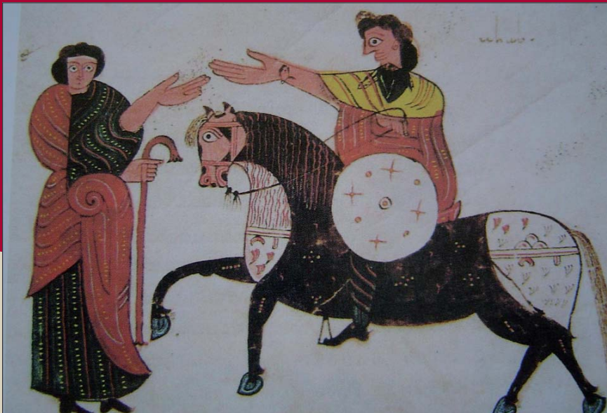
FIG. 13.- Fol. 145 r. Encuentro entre Acab y Elías. Caballo y jinete preparados para la batalla.

Hab 3:8 "¿Acaso, Yavé, se enciende tu ira contra los ríos, o es contra los mares tu furor cuando subes sobre tus caballos sobre tus carros de victoria?"