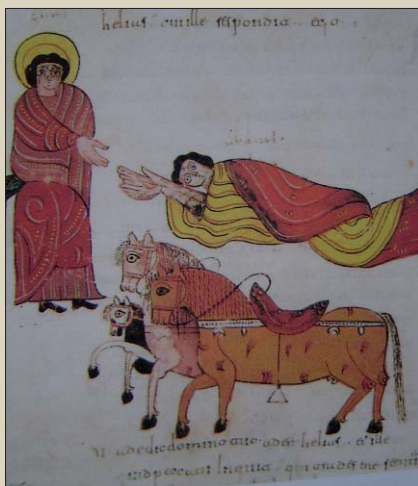
FIG. 11. Fol. 144 v. Abdías se postra ante Elías. Caballos de distintas capas ricamente ajaezados.