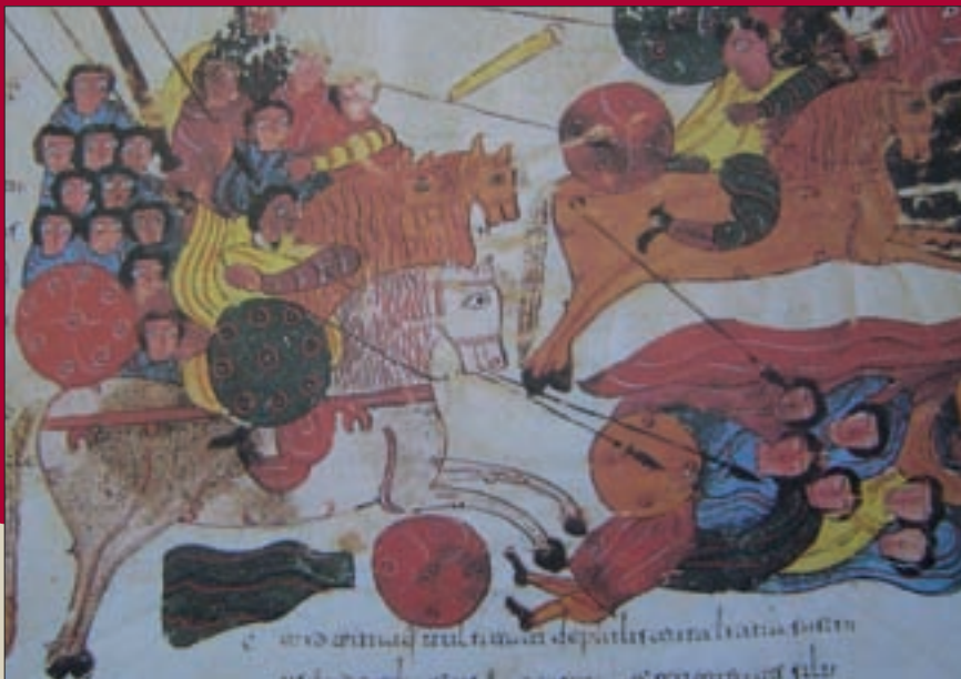
FIG. 8.- Fol. 119 r. Caballos en la guerra. Los israelitas en batalla contra los filisteos.