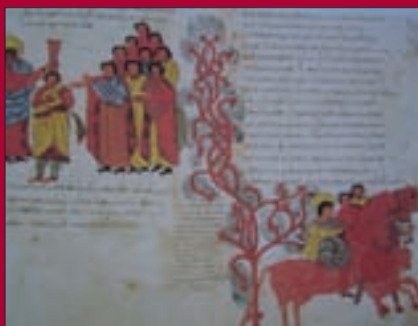
FIG. 9.- Fol. 118 r. Samuel unge a David. Saúl y su ejército.