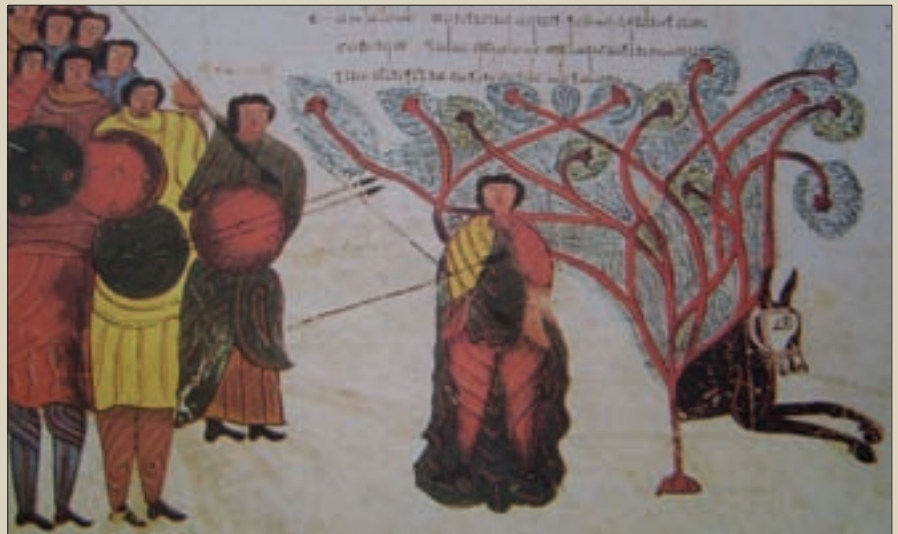
FIG. 7.- Fol. 131 v. Muerte de Absalón.

Jer 8:16 > "Ya se oye desde Dan el relinchar de los caballos. Al estruendo de los relinchos de sus corceles tiembla la tierra toda. Ya vienen a devorar la tierra