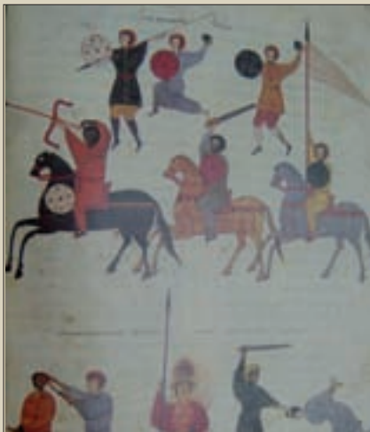
FIG. 6.- Visión del profeta Daniel. Conquista de Jerusalén. Nabucodonosor ciega al rey Sedecías y decapita a sus hijos.